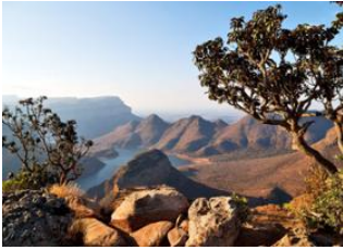
Blyde River Canyon 📍