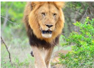
Blyde River Canyon 📍 🚗 120km - 🕒 3h Parc National Kruger 📍