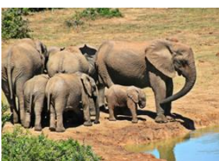
Parc National Kruger 📍