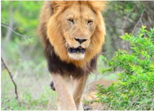
Réserve de Manyeleti 📍