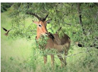
Réserve de Manyeleti 📍