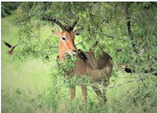
Réserve de Manyeleti